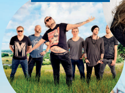
2 blyga läppar